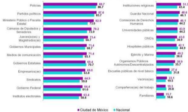
Percepción sobre la frecuencia de corrupción en diversos sectores (muy frecuente o frecuente, porcentaje)

En la Ciudad de México, 88.7% de la población de 18 años y más percibió que la corrupción es una práctica muy frecuente o frecuente en los policías , seguido de los partidos políticos con 87.6 por ciento .